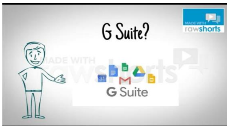
Figura 2: Interatividade do artefato

A intenção nesta parte do vídeo era exibir quais ícones estão disponíveis no pacote pela Google, como incentivo para o trabalho colaborativo na educação.